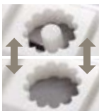
Combinazione/Matching/ Combinaison/ Combinación/ Комбинирующая/Combinação DR58 (ø 40)