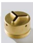
M88 liscia/smooth/lisse/ lisa/гладкая/lisalisse