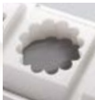
DR25 (ø 50)