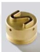
P14 rigata sinistra/star left/ crantée gauche/rizada izquierda/ рельефная слева/estriada esquerda