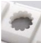
DR58 (ø 40)