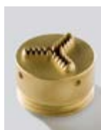
M88 rigata/star/crantée/ rizada/рельфная/estriada