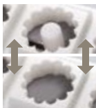
Combinazione/Matching/ Combinaison/ Combinación/ Комбинирующая/Combinação DR25 (ø 50)