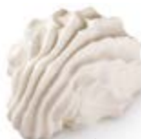
*NO JUNIOR M480 ↕ ↔