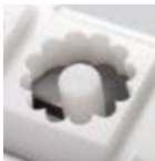
DR25 (ø 50)