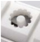
DR58 (ø 40)