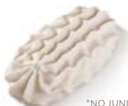
*NO JUNIOR M482 ↕ ↔